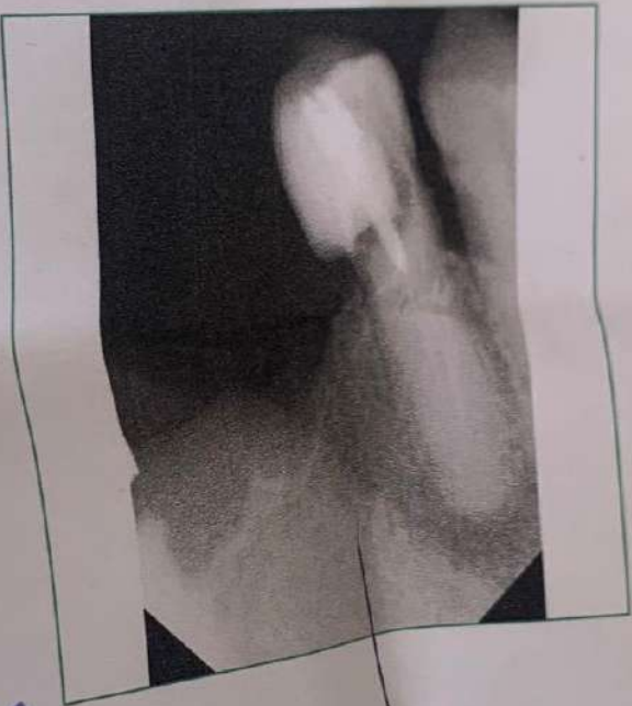
Chart No: 20230606_194648 Name: mahrady mustapha Gender: Homme Age: 0Y